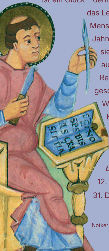
Notker Balbulus

Wer im frühen Mittelalter eine Urkunde verfassen oder einen Brief schreiben wollte, nutzte dafür meist Vorlagen, sogenannte Formulae. Das Projekt bereitet diese Muster wissenschaftlich auf und macht sie für alle zugänglich. Oft wurde diese Art von Dokumenten gar nicht aufgehoben. Dass einige überlebt haben, ist ein Glück – denn sie geben Einblick in das Leben und Denken der Menschen vor mehr als 1000 Jahren. Zudem erlauben sie neue Antworten auf Fragen der Sozial-, Rechts- und Mentalitätsgeschichte sowie der Wirtschafts- und Kulturgeschichte.