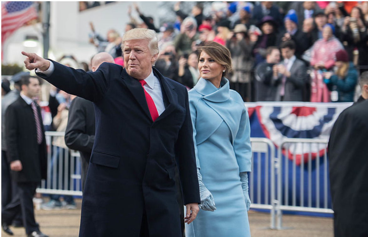
Präsident Trump zeigt auf die Menge, während er mit seiner Ehefrau Melania Trump an der Tribüne der 58. Inaugurationsparade in Washington D.C. vorbeigeht.