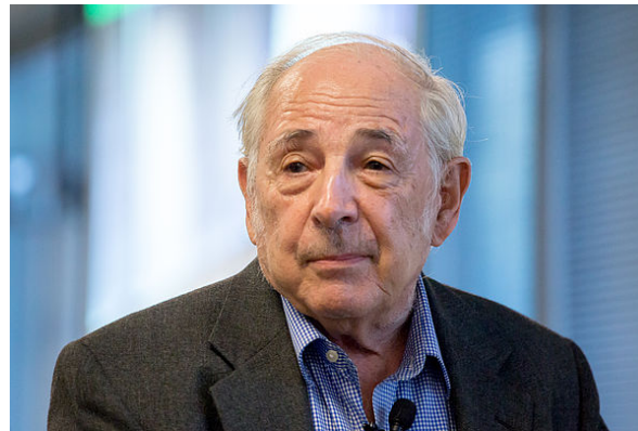
Portrait John Rogers Searle, ein amerikanischer Philosoph

Hier lohnt ein näherer Blick aus sprachphilosophischer Richtung. Vor dem Hintergrund der Amtseinführung und der nachfolgenden Diskussion gewinnt sie an neuer Relevanz, kann sie doch der Debatte um