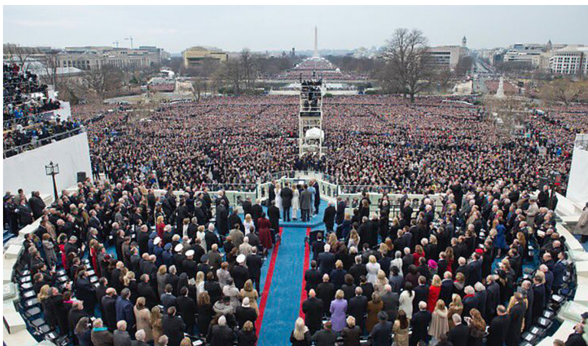
Die Amtseinführung von Donald Trump vor dem Kapitol in Washington D.C aus der Sicht des US-Präsidenten.

Essay von Colin von Negenborn, 24. Februar 2023